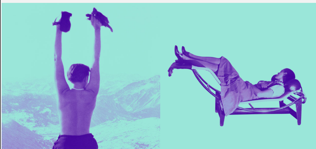
Gauche : Charlotte Perriand face à la vallée, vers 1930. Droite : Charlotte Perriand sur la « Chaise longue basculante, B306 » (1928-1929) – Le Corbusier, P. Jeanneret, C. Perriand, vers 1928