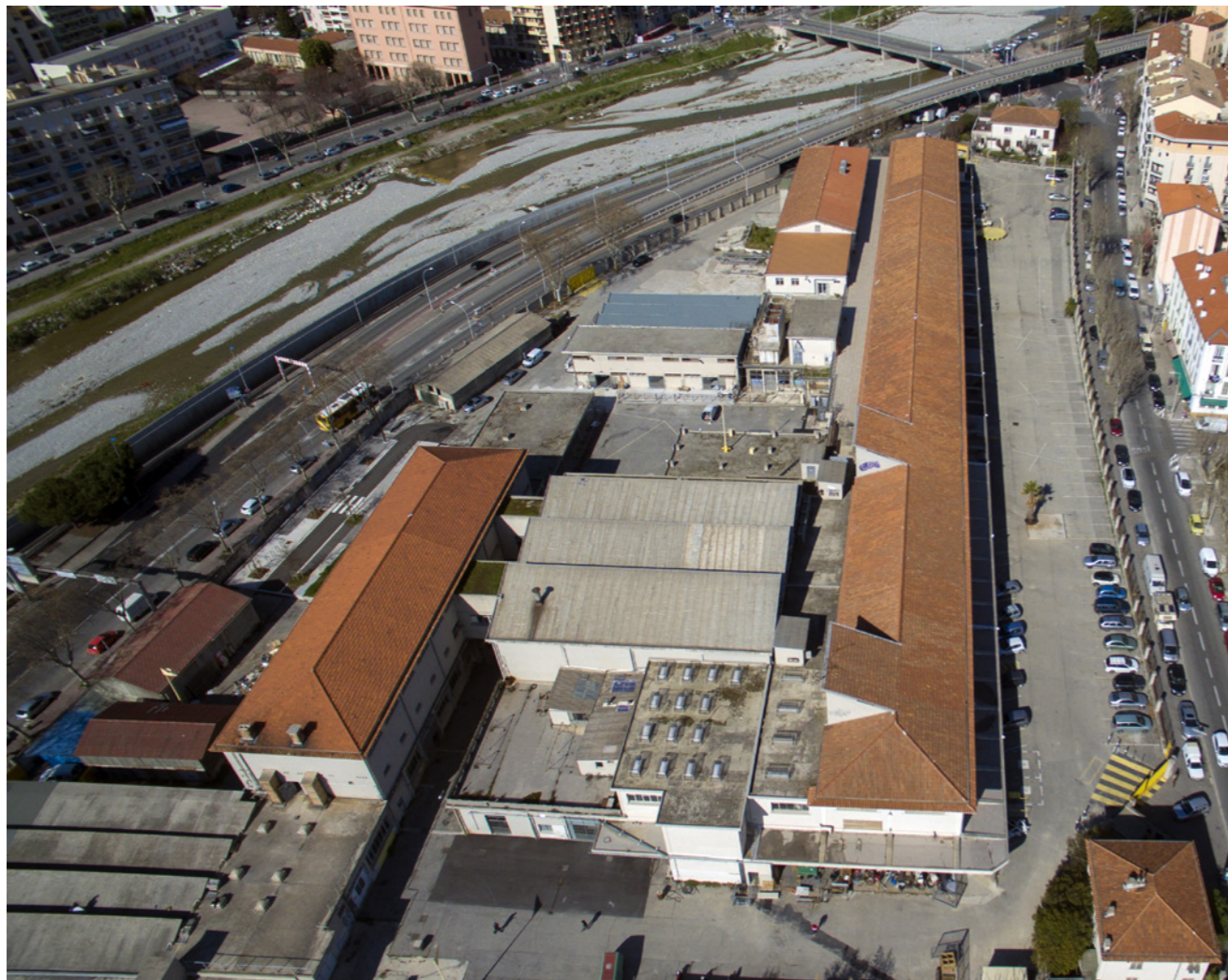
Vu aérienne du 109