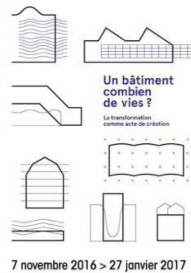
Exposition Forum d'Urbanisme et d'Architecture