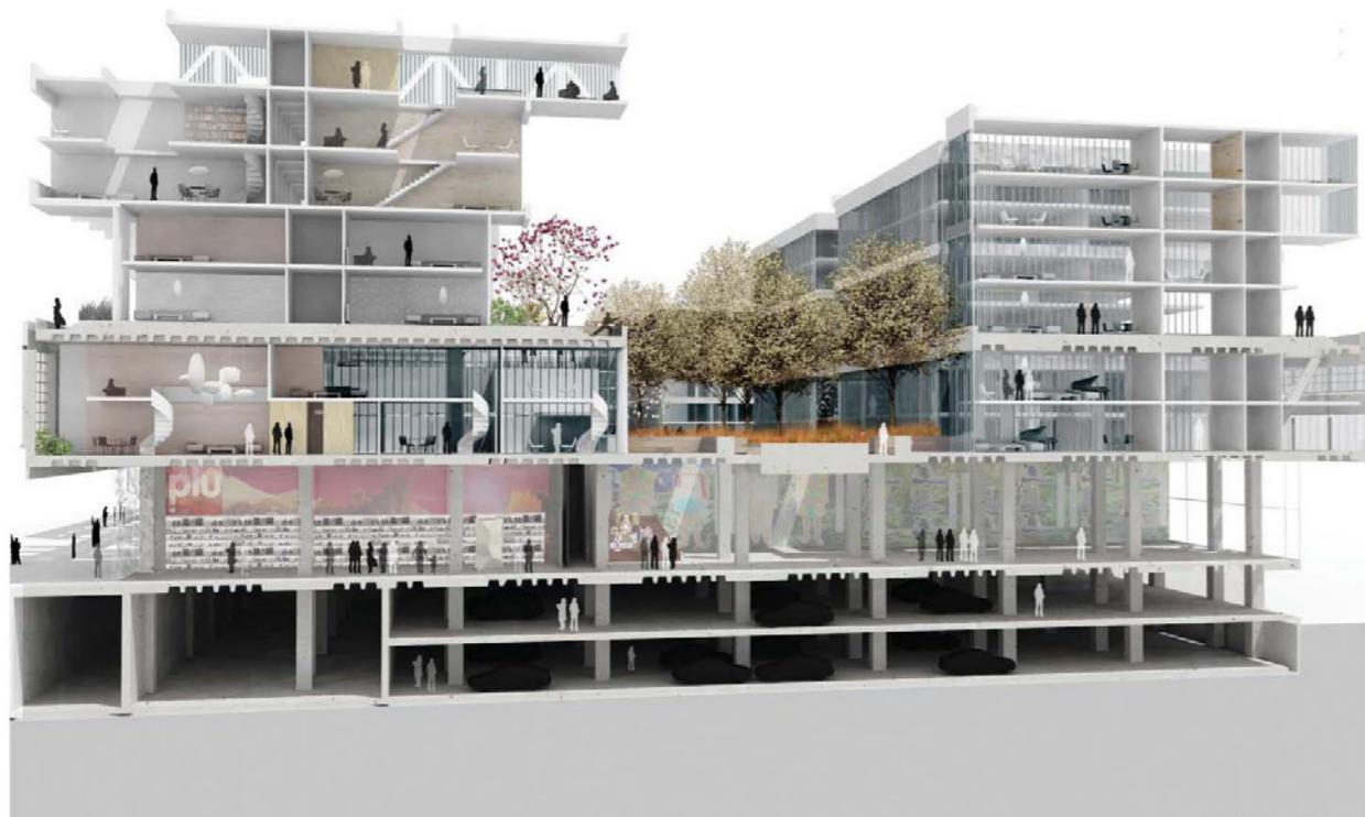
OMA, Entrepôt macdonald, Paris, 2000-2018

Le processus par juxtaposition pose l'hypothèse que la densification de la ville se fait à partir d'un redécoupage du sol, par sa « parcellisation ». Le groupe travaillera sur le principe issu de la longue tradition du développement urbain où les grandes parcelles sont redécoupées pour être alloties (projet mené collectivement par 4 ou 6 étudiants). A partir de ce redécoupage ou recomposition foncière, les projets d'édifices seront menés individuellement ou par deux, travail mené à l'échelle des parcelles nouvellement créées.