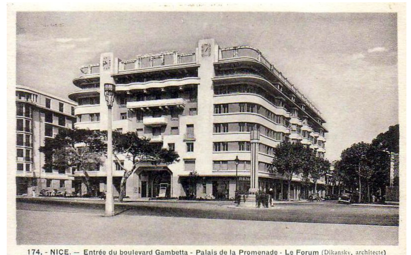
174. - NICE. — Entrée du boulevard Gambetta - Palais de la Promenade - Le Forum (Dikansky, architecte)

Le deuxième séminaire est plus thématique. A partir des attendus des ateliers de projet nous chercheront à constituer un corpus de références contemporaines ; macro-lots, projets à la parcelle, structures particulières pour les superpositions programmatiques, surélévations etc. Ce séminaire peut être l'occasion pour les étudiants de mener leur TPE ou TPE-R.