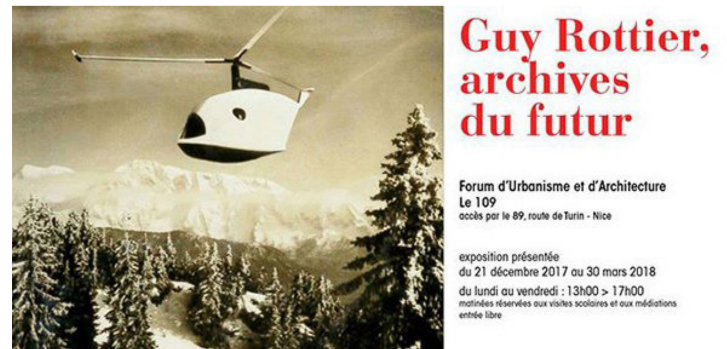
Exposition Forum d'Urbanisme et d'Architecture