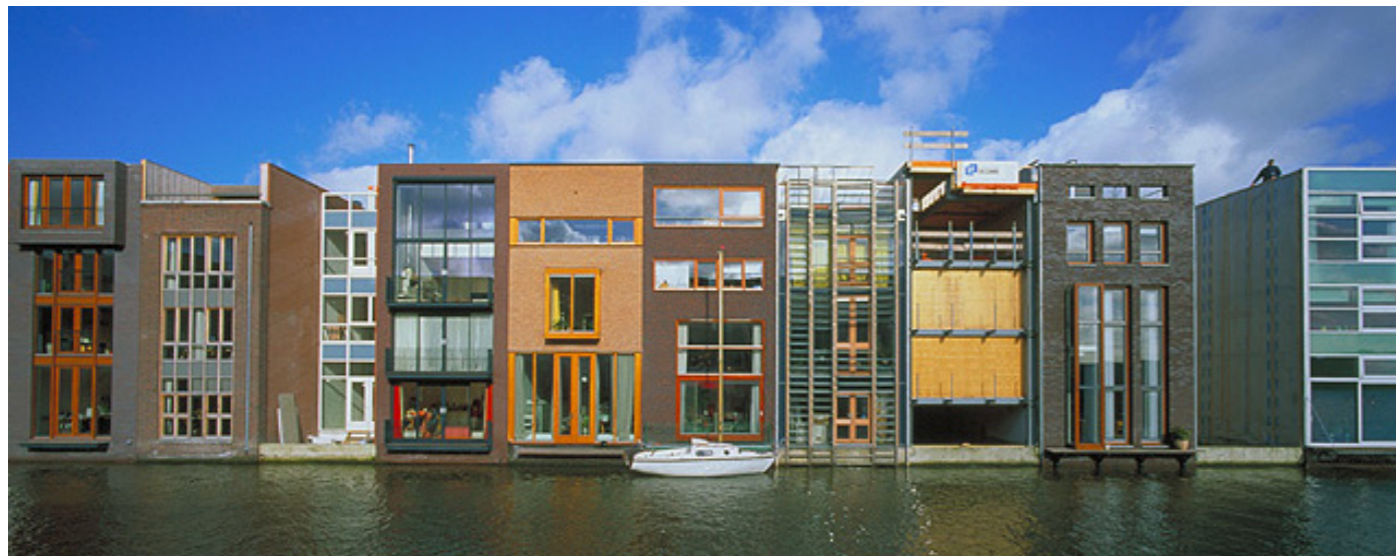
West8, Bornéo et Sporenburg, Amsterdam, Pays-Bas, 1993-96