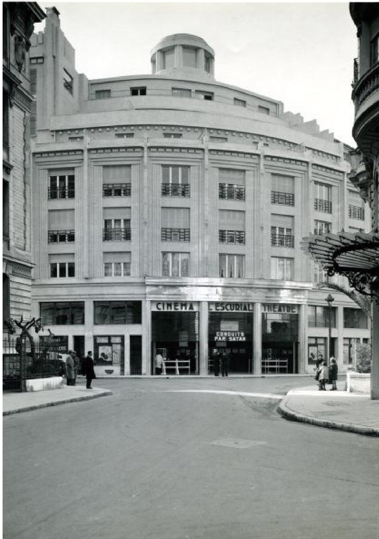
Immeuble et cinéma l'Escurial (1931) architecte Varthality