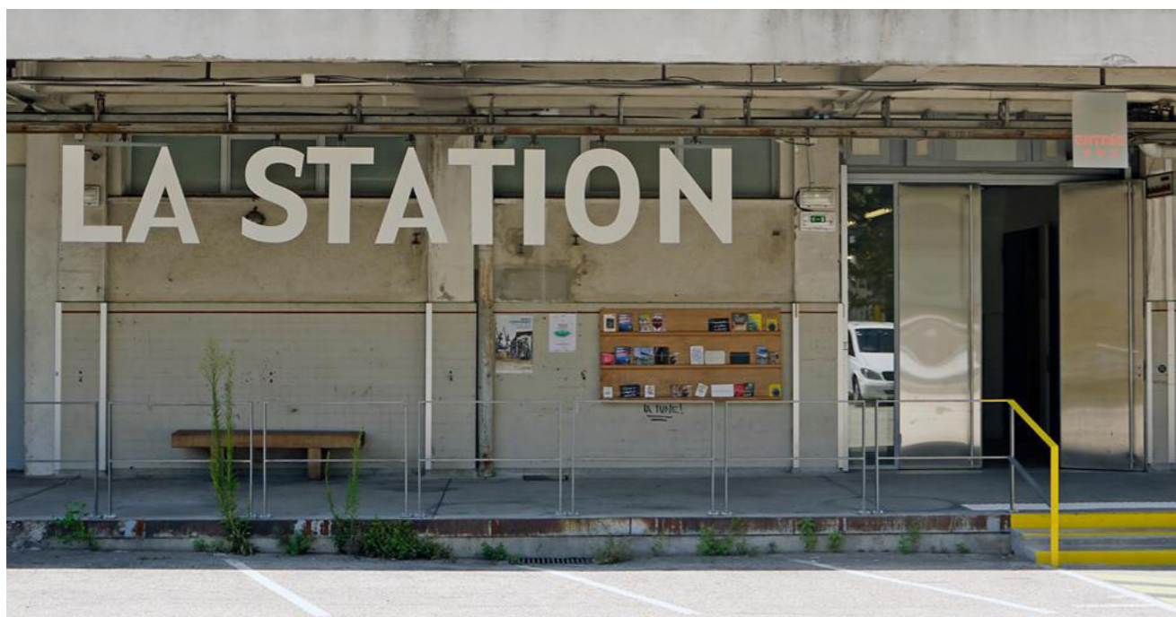
Résidence d'artistes LA STATION

Les ateliers de projet s'attacheront aux questions de distributions, à l'échelle du site, aux structures constructives à même de permettre la superposition de programmes. Plus largement sera engagée la question de la réinterprétation et utilisation de processus analogiques pour concevoir le projet contemporain.