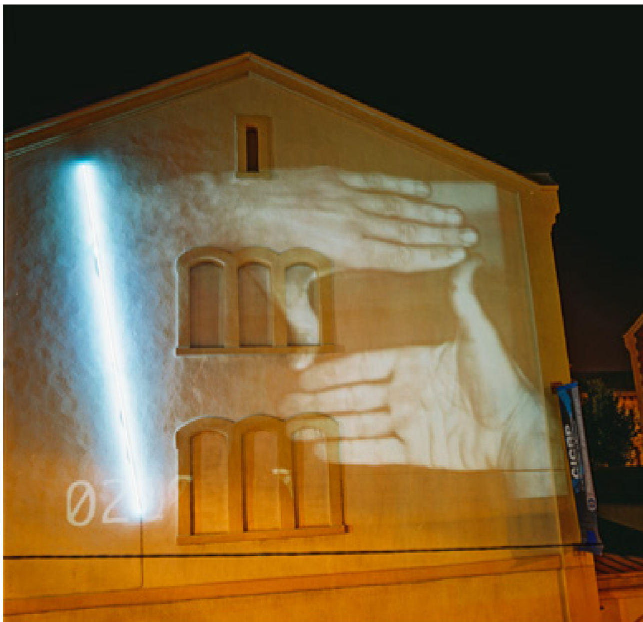
Groupe Dunes, Façades, Friche de la Belle de Mai, 2003