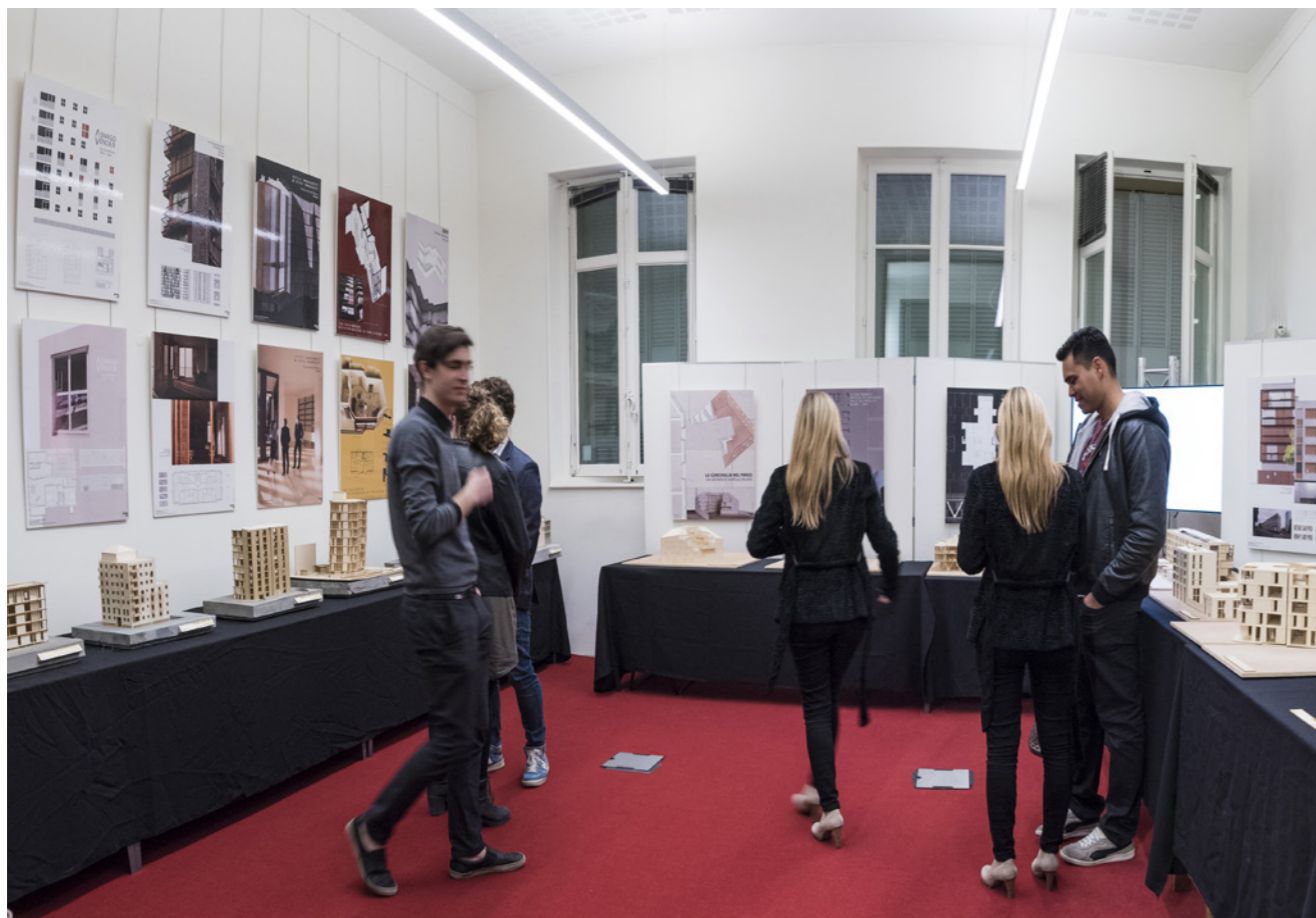
Exposition Ordre de l'architecte, 2017