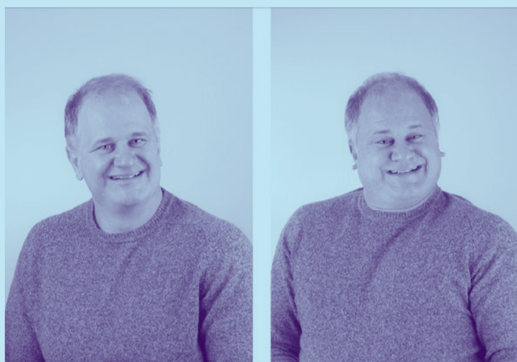
Double self-portrait (Inverted), 2015 © Colin Cook/Mirko Mayer Gallery / m-projects