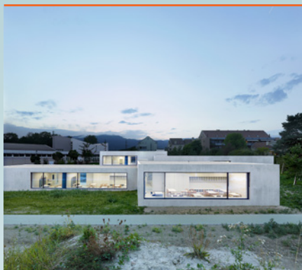
École enfantine et unité d'accueil pour écoliers (JAPE) - Prangins, Canton de Vaud