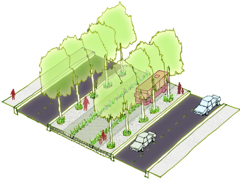
Chemins urbains pour TC