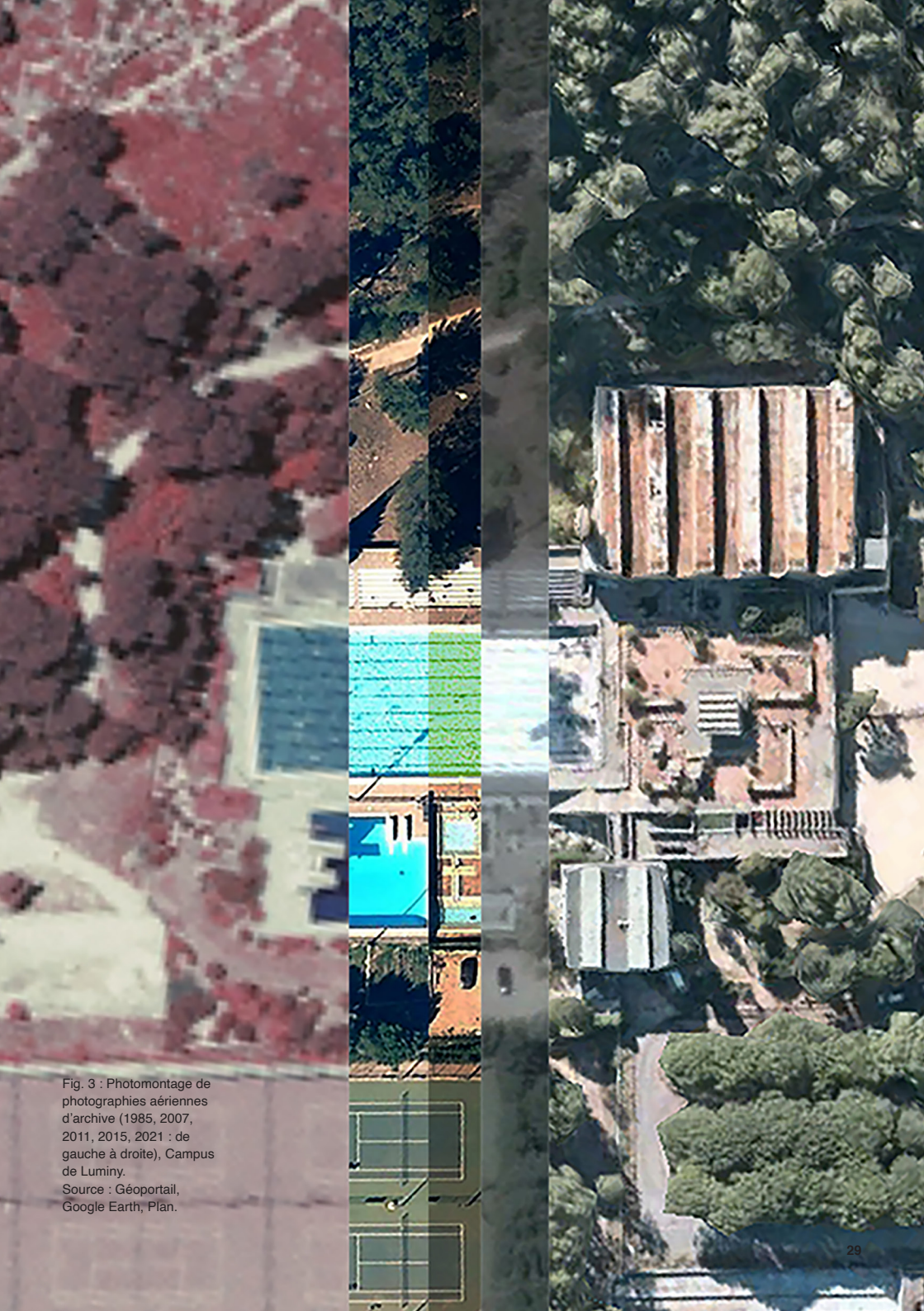
Fig. 3 : Photomontage de photographies aériennes d'archive (1985, 2007, 2011, 2015, 2021 : de gauche à droite), Campus de Luminy.