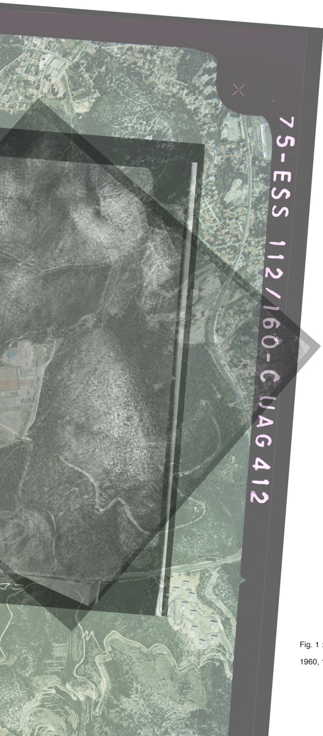
Fig. 1 : Photomontage de photos aériennes d'archive (1947, 1960, 1975), Campus de Luminy.