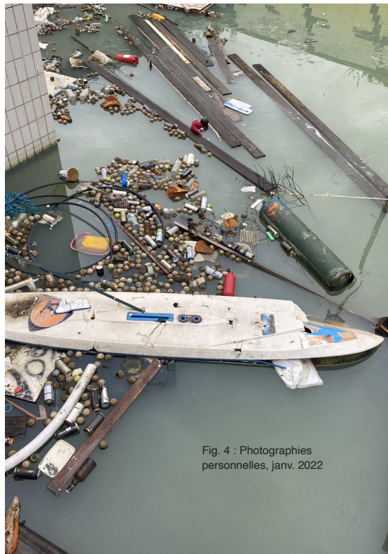
Fig. 4 : Photographies personnelles, janv. 2022