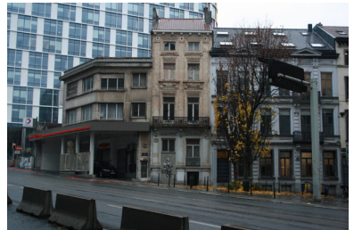
FIG. 2. Angle rue de Pascale et rue Belliard