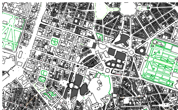
FIG. 17. Carte des bâtiments appartenant à l'Union européenne. Données : site officiel de la Commission européenne.

Il faut préciser qu'ils sont inadaptés à une fonction autre que du bureau, mais dans certains cas, semblables au Berlaymont, les immeubles doivent être remis à neuf tant ils deviennent aussi bien obsolètes pour leur usage d'origine que pour un autre. Il n'y avait pas vraiment de plan directeur pour cette intervention tous ces locaux. Initialement, les bâtiments Berlaymont et Charlemagne étaient prévus (et comme nous allons le voir, la position de Charlemagne à son emplacement actuel a été influencé par la présence des lobbies). D'autres constructions sont apparues avec des latences entre les livraisons, certains bureaux possèdent leur propre tour, d'autres s'imbriquent au sein de programmes divers (notamment privés).