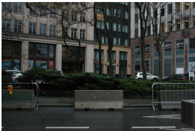
FIG. 11. Rue du Champ de Mars