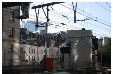
FIG. 3. Gare de Bruxelles Schuman