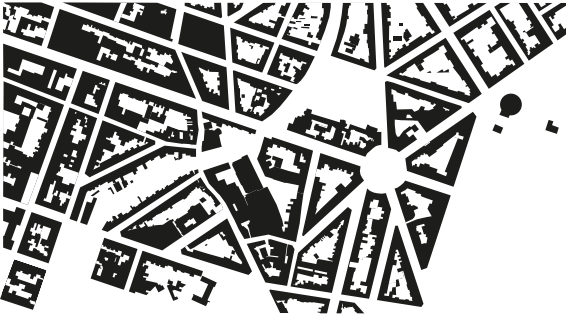
FIG. 5. Carte de l'emprise du bâti en 1961