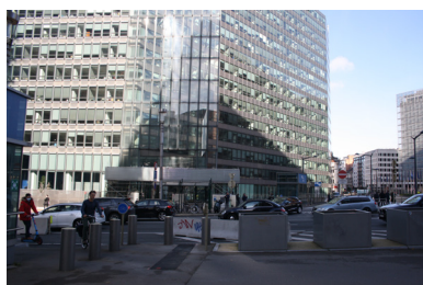
FIG. 14. Esplanade du Conseil de l'Europe, avec le bâtiment Charlemagne en fond.