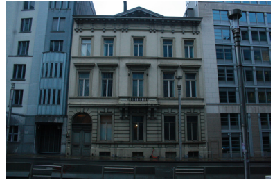
FIG. 1. Rue de la Loi 70

La morphologie urbaine du quartier a muté à tel point que ses propres limites symboliques se sont reflétées