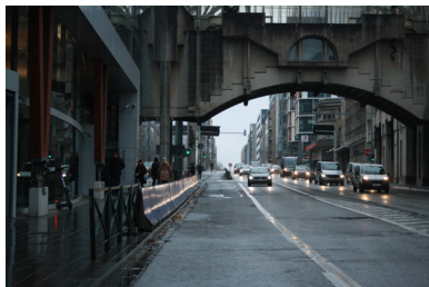
FIG. 12. Rue Belliard, avec le Comité des Régions

Des barrières métalliques recouvertes d'aluminium créent une sorte de frontière nette entre le trottoir et la chaussée. Elles sont le plus souvent accompagnées de potelets de la même matérialité. Les limites administratives ouest du quartier correspondent à la frontière avec les anciennes murailles de la ville, aujourd'hui un boulevard urbain sur plusieurs niveaux. Le secteur est déjà historiquement coupé du centre-ville mais aussi des quartiers alentours qui n'ont pas adopté le même plan tramé que celui-ci, se résultant à des discontinuités urbaines et des problèmes de raccordement des rues autour des frontières du quartier européen. Les infrastructures de transport, bien que