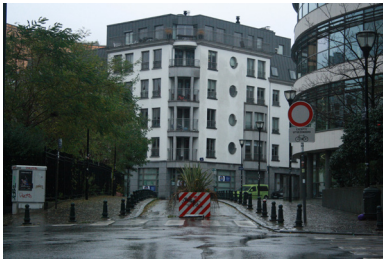
FIG. 10. Rue du Champ de Mars