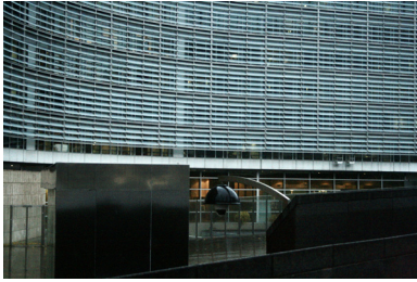
FIG. 16. .Caméra de vidéosurveillance planquée dans un lampadaire devant le bâtiment Berlaymont

déjà existantes avant 1960, sont une barrière en soit, car je n'imagine pas une gare moitié enterrée, moitié aérienne ne pas prendre moins de place que celle de Bruxelles-Schuman n'en occupe. »