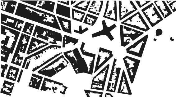
FIG. 6. Carte de l'emprise du bâti en 1971