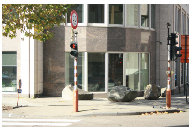
FIG. 13. Angle avenue de Cortenbergh et rue Le Corrége