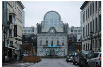
FIG. 4. Ancienne gare du Luxembourg