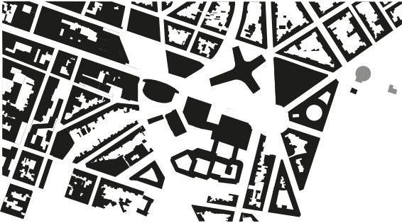
FIG. 8. Carte de l'emprise du bâti en 2020