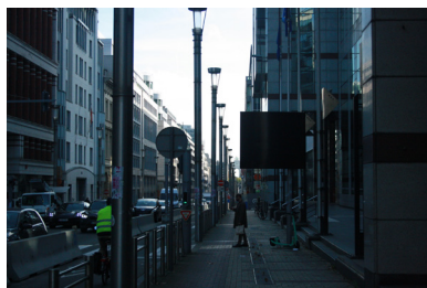
FIG. 15. Rue de la Loi dans son ensemble.