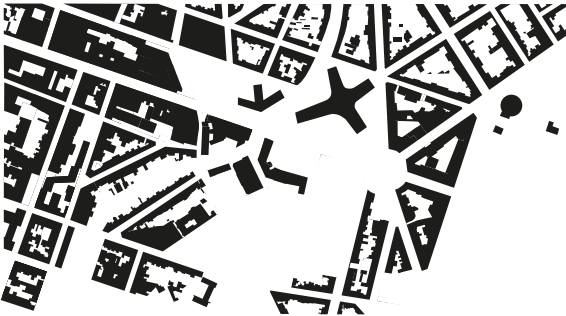
FIG. 7. Carte de l'emprise du bâti en 1987