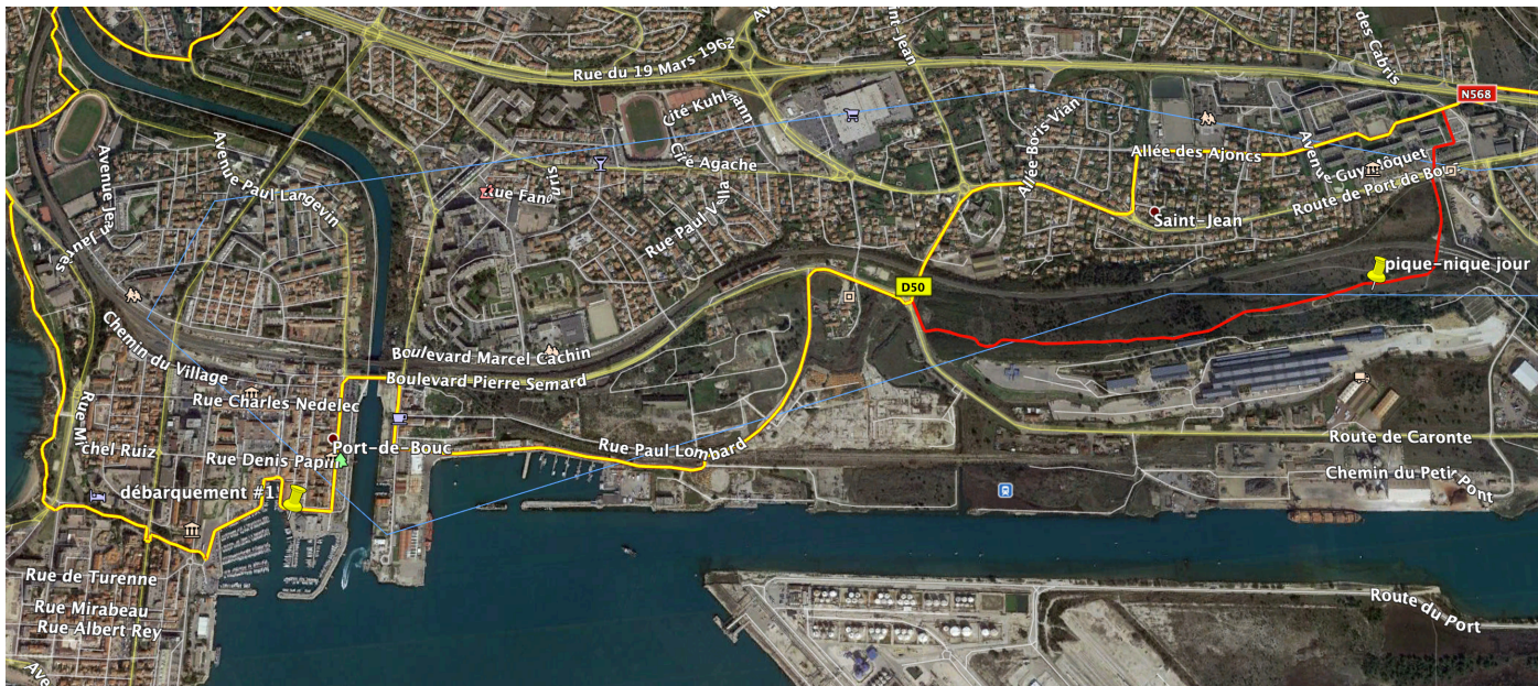
Départ de le port de Port de Bouc, suivi de l'itinéraire du GR2013 (en jaune) suivi de la variante par le plateau du Campéu (en rouge)