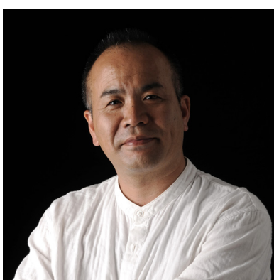
Yasuhiro Yamashita Atelier Tekuto