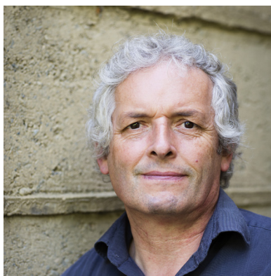
Martin Rauch Lehm Ton Erde