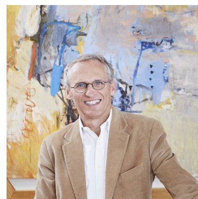
Luigi Rosselli Luigi Rosselli Architects