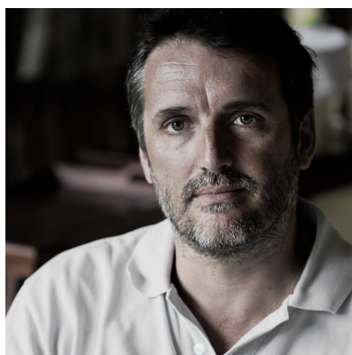
Urko Sanchez Urko Sanchez Architects