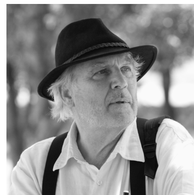
Gilles Perraudin Perraudin Architecture