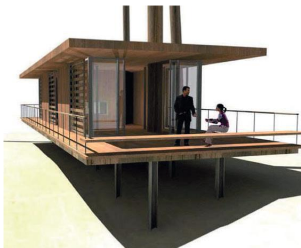
MAISONS SUR PILOTIS (Touraine et Charentes-Maritimes)