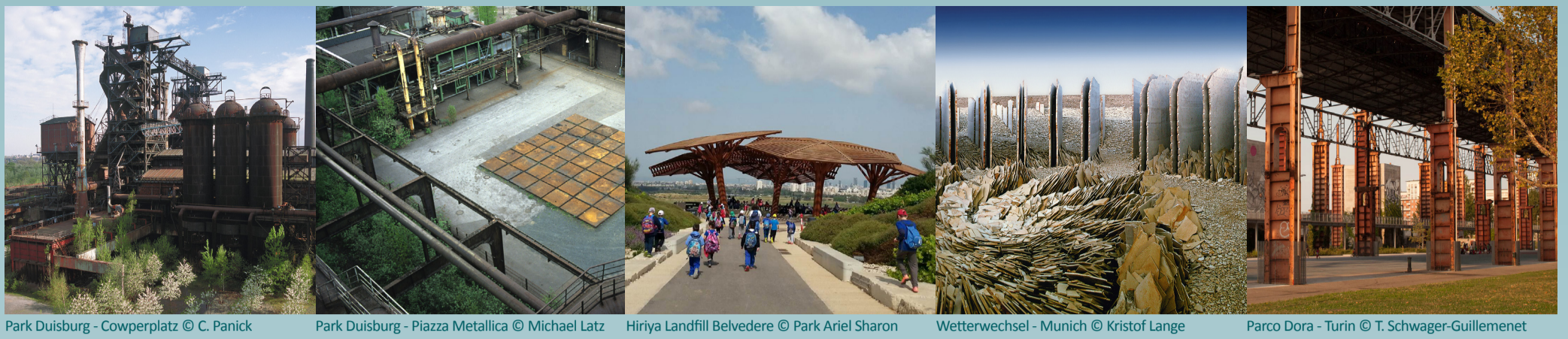
Park Duisburg - Cowperplatz